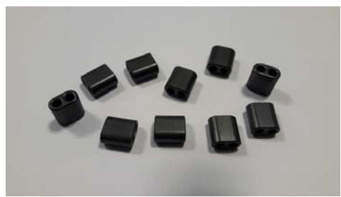
MFB-0380(전력선통신 신호 보호 필터용): 10EA