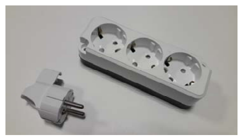
플러그 + 3구 콘센트