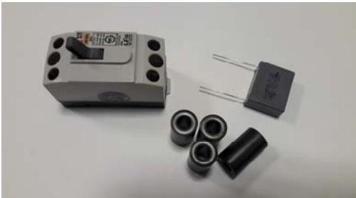
차단기 + plcBlockingFilter-B형