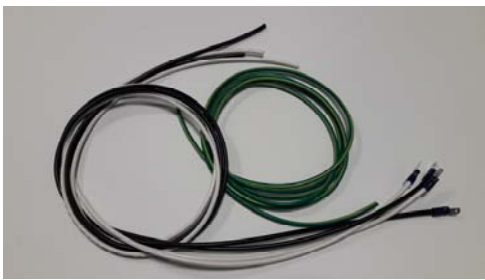
2.5SQ 전선 5EA